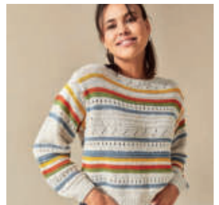
Le pull PHIL PÉTILLANT