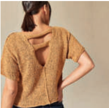
Le pull PHIL DENTELLE