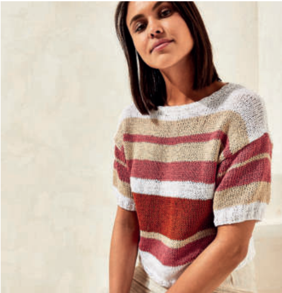
Le pull PHIL EUCALYPTUS