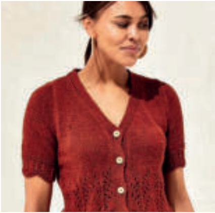
Le gilet court PHIL RUSTIQUE