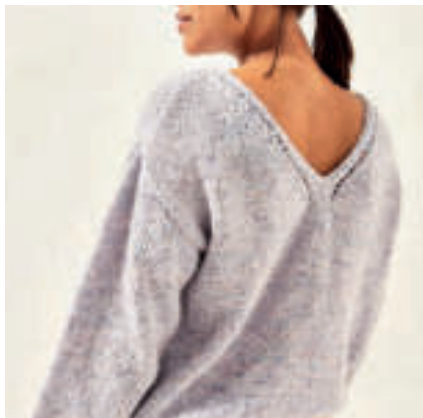
Le pull PHIL RAINBOW & LIGHT