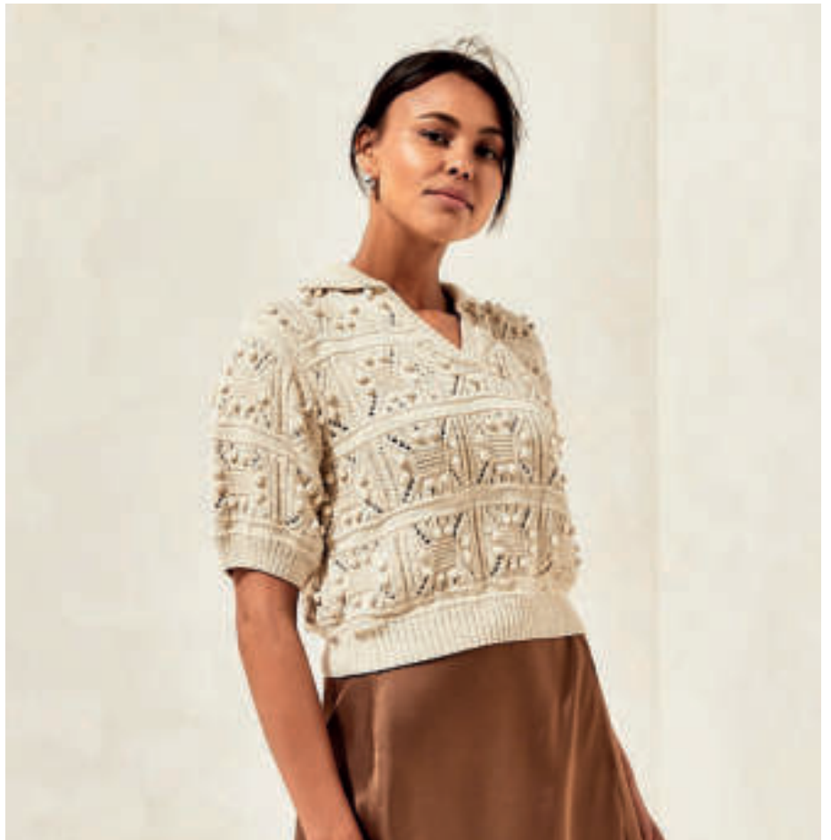
Le pull PHIL PERLE