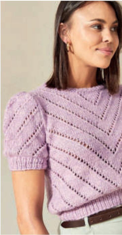
Le pull PHIL BONBON