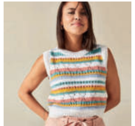
Le pull PHIL CABOTINE & BABY DOLL