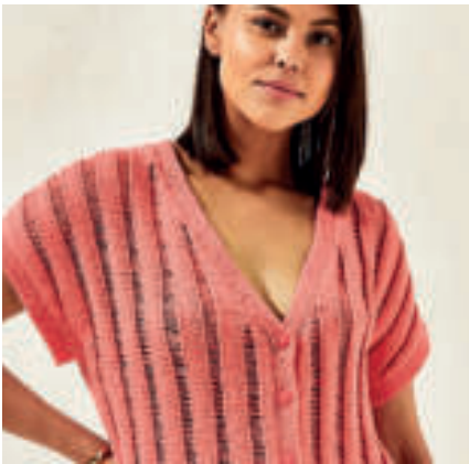
Le gilet sans manche PHIL LOVE COTTON