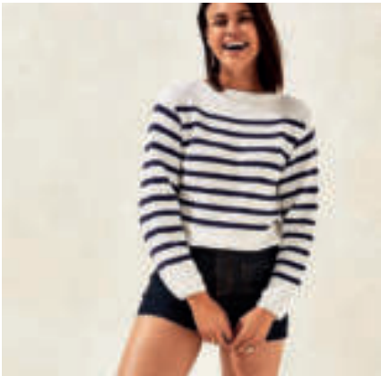
Le pull PHIL GREEN