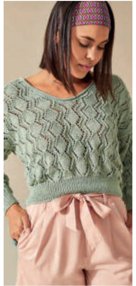
Le pull PHIL OCEAN