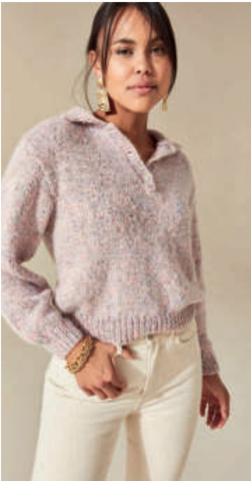
Le pull PHIL RAINBOW & LIGHT