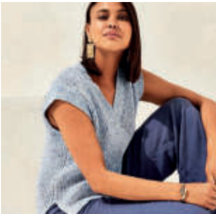
Le pull PHIL BERLINGOT