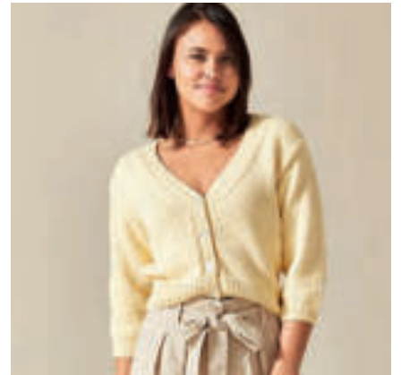
Le gilet PHIL PIMA