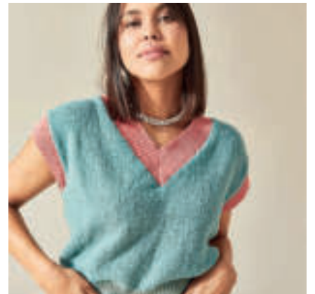
Le débardeur PHIL ÉCOCOTON & BABY DOLL