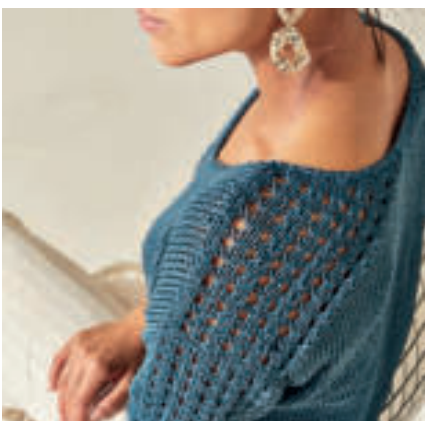
Le pull PHIL EUCALYPTUS