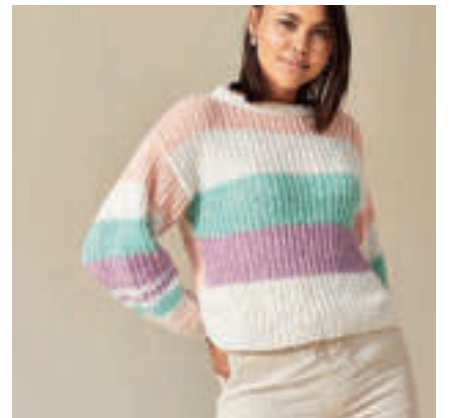
Le pull PHIL BONBON