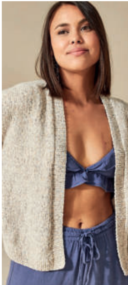
Le gilet PHIL TUTTI FRUTTI