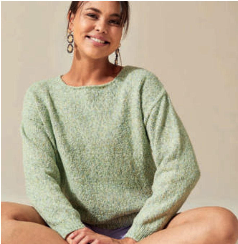
Le gilet PHIL TUTTI FRUTTI