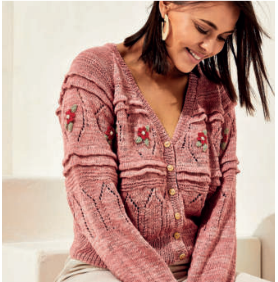
Le gilet PHIL NATURE