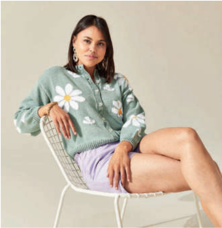
Le gilet PHIL ÉCOCOTON