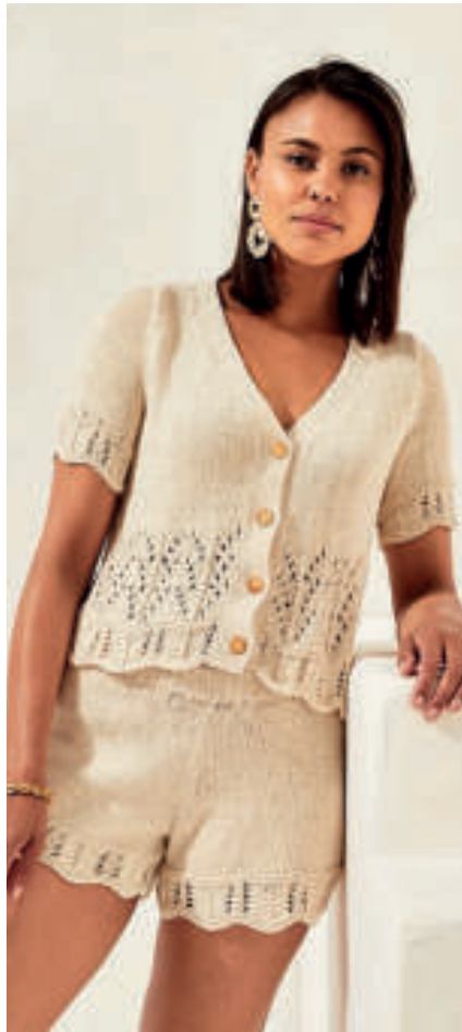
Le pull & short PHIL RUSTIQUE