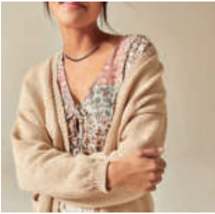
Le gilet PHIL GREEN