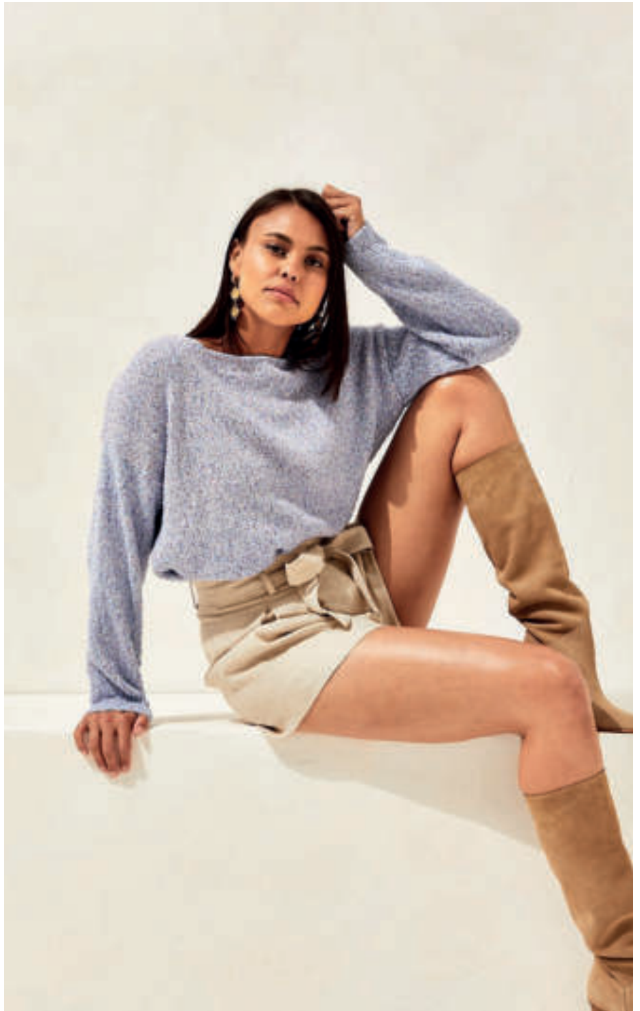
Le pull PHIL TUTTI FRUTTI